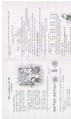
Mathematikbuch von 1950