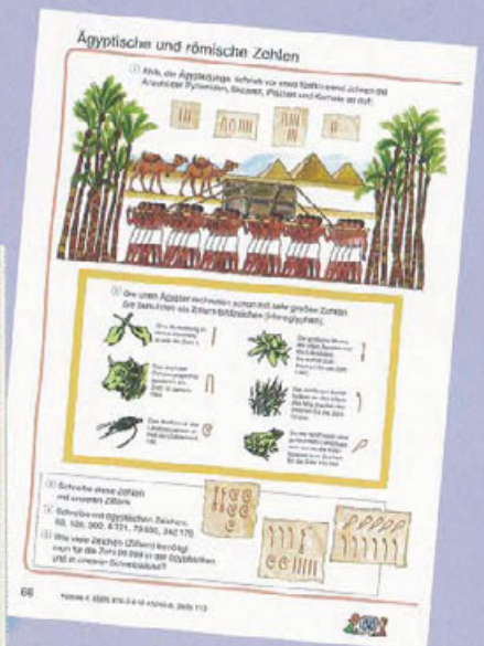
Spannende Matheabenteuer 96 S., geb. € 12,80 [D] ISBN 978-3-619-15461-8